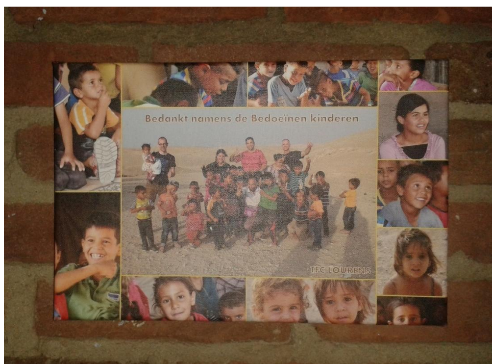
Foto als bedankje in de Sionskerk

Bij alle projecten zijn jongeren bewust gemaakt van diaconaal handelen en hebben zij door middel van acties geld ingezameld voor het doel. Met dit geld heeft de jeugd van de Hervormde Gemeente Nunspeet bijvoorbeeld het zomerkamp voor de Bedoeïenen-kinderen in Israël mogelijk gemaakt.