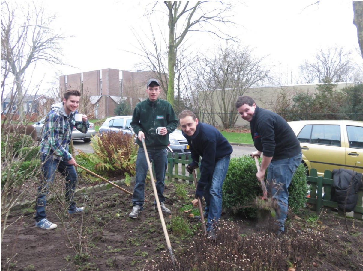
Jongeren aan het werk in een voortuin tijdens Samen Kerst 2015